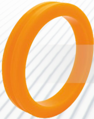
KOŁO 373x56/300 Okładzina na orczyk Szczyrkowski Ośrodek Narciarski (SON)