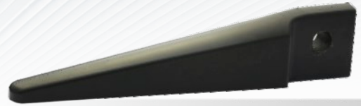
JĘZYK NABIEGOWY 185x32 h32 mm