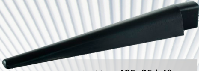
JĘZYK NABIEGOWY 195x35 h40mm Ośrodek Narciarski Tumia