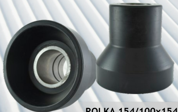
ROLKA 154/100x154 (wypręg) Doppelmayr Stacja Narciarska GrapSki (Litwinka)