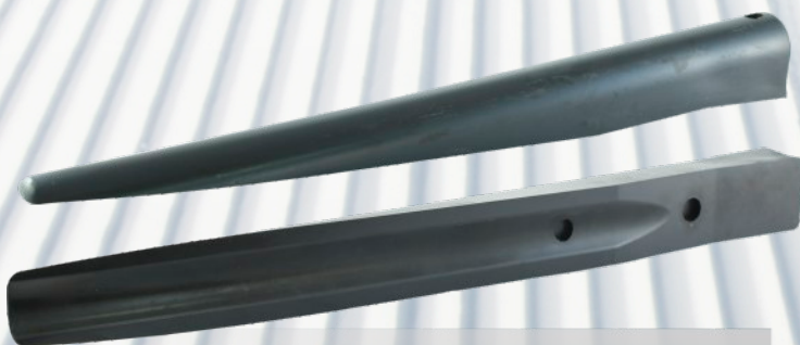
JĘZYK NABIEGOWY 500x60 h60 mm Doppelmayr Stacja Narciarska GrapSki (Litwinka)