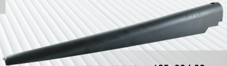
JĘZYK NABIEGOWY 185x32 h32 mm