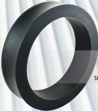
KOŁO 406x80/320 Doppelmayr Stacja Narciarska GrapSki (Litwinka)