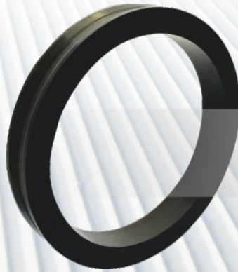
KOŁO 190x40/250 Wyciągi firm Bachleda i Glob