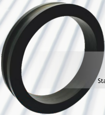
KOŁO 406x90/320 Doppelmayr Stacja Narciarska GrapSki (Litwinka)